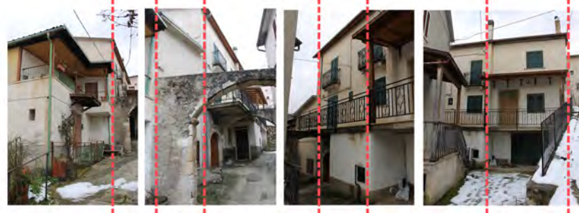
Via degli Archi Antichi