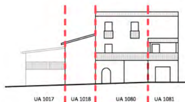
Via degli Archi Antichi